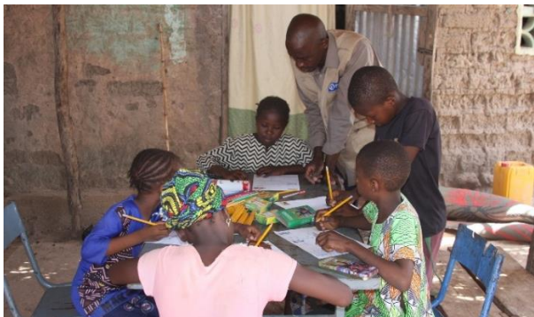
Patenkinder in Mali schreiben gemeinsam Briefe an ihre Pat:innen

Sie, alle Zeichnungen der Kinder in einem Brief zusammenzufassen. Sie können auch gern Fotos (zum Beispiel von Ihrer Kindergartengruppe, Ihrer Kita oder Ihrem Wohnort) beilegen. Die Post wird über das Hamburger Büro an Ihr Patenkind geschickt. Sie können uns auch eine E-Mail für Ihr Patenkind schicken oder Sie nutzen den Bereich „Mein Plan“ auf unserer Internetseite: www.plan.de/mein-plan . In der Regel antwortet Ihr Patenkind innerhalb einiger Wochen auf Ihren Brief.