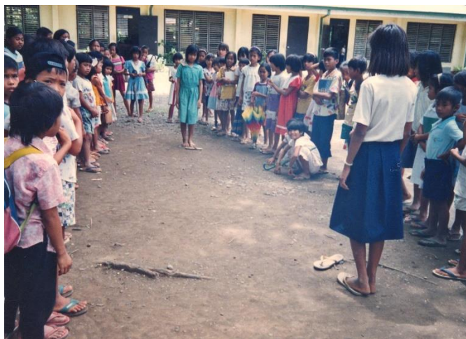
Die Aufstellung zum Spiel Slipper.

Ziel des Spiels ist, verschiedene Aufgaben fehlerfrei aufzuführen und dabei immer einen Schuh des Gegners zu treffen. Die Mannschaft, die alle Aufgaben zuerst fehlerfrei gelöst hat, gewinnt das Spiel. Spielen nur zwei Kinder, geht jeder Spieler erst dann zur nächsten Aufgabe über, wenn er die erste beendet hat.