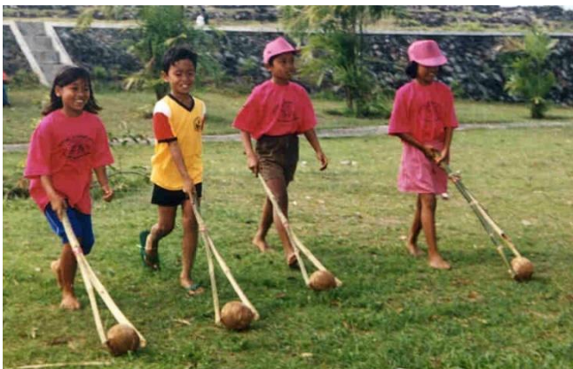
Kinder in Indonesien spielen Glindingan.

Die Stöcke werden dafür gekreuzt mit einem festen Band zusammengebunden, so dass vorn eine Gabel entsteht. Je nach Schwierigkeitsgrad dürfen die Stöcke mit beiden Händen oder nur mit einer Hand geführt werden.