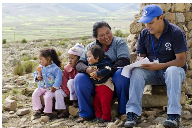
Ein Plan-Mitarbeiter in Bolivien nimmt die Daten eines Patenkindes und seiner Familie auf.

Ja, wir freuen uns, dass bereits fast Hundert Kindergärten und -gruppen in Deutschland über Plan eine Patenschaft übernommen haben. Die Patenschaft läuft meist auf den Namen des Kindergartens und ggf. der Gruppe (beispielsweise Gruppe Max & Moritz, Kindergarten Rappelkiste). Bitte geben Sie uns darüber hinaus den Namen einer Ansprechperson an, die für Fragen rund um die Patenschaft zur Verfügung steht.