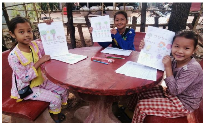
Patenkinder in Kambodscha schreiben gemeinsam Briefe an ihre Pat:innen